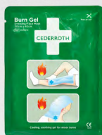
Burn Gel Dressing / Face Mask 30x40 cm, REF: 51011014

Steriel universeel verband met 4 functies, speciaal geschikt voor vingers en tenen.