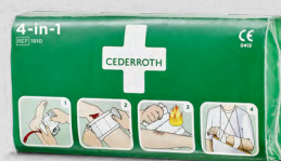
Cederroth 4-in-1 Bloedstelpende verbanden, REF 1910

Het is een zelfklevende lijmvrije pleister en plakt daardoor niet vast aan huid of haar. Is perfect geschikt voor vingers of tenen. Gemakkelijk om kleine handen te wikkelen of als u een kleinere wond hebt.