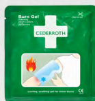
Burn Gel Dressing 20x20 cm REF 51011015

Groot brandwondenkompres dat een snelle verkoeling geeft en de pijn effectief verlicht bij eerste- en tweedegraads brandwonden. Geschikt voor brandwonden op grotere oppervlakken zoals benen, armen of borst. Kan ook worden gebruikt als gezichtsmasker.