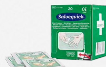
Salvequick Wondreiniger 20 stuks REF 323700

Steriel, bijzonderlijk verpakt. Past in de Wound Care Dispenser.