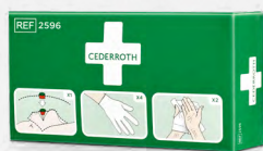
Cederroth Protection Kit REF 2596

Op water gebaseerde gel voor kleinere brandwonden, verbrandingen en zonnebrand. Functioneert als een tijdelijke beschermende barrière die de huid koelt en kalmeert en daarmee de pijn vermindert. Kan verscheidene keren worden gebruikt.