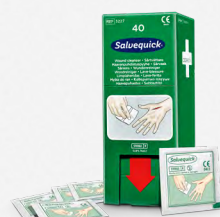
Salvequick Wondreiniger 40 stuks REF 3227

Steriel, bijzonderlijk verpakt. Past in de Wound Care Dispenser.