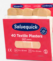
Salvequick Textielpleisters REF 6444

Elke navulling bevat 45 pleisters (27 st. 72 x 19 mm en 18 st. 72 x 25 mm). 6 navullingen/doors.