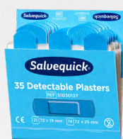
Salvequick Blue Detectable REF 51030127

Extra zacht en flexibel. Detecteerbaar door de meeste metaaldetectoren die in de levensmiddelenindustrie worden gebruikt. Salvequick Blue Detectable Pleisters. Elke navulling bevat 35 pleisters (21 st. 72 x 19 mm en 14 st. 72 x 25 mm). 6 navullingen/doors.