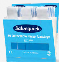
Salvequick Detectable Finger Bandage REF 6796

Extra lange blauwe pleisters die gemakkelijk rond de vinger gewikkeld kunnen worden. Zacht en flexibel, detecteerbaar door de meeste metaaldetectoren die in de levensmiddelenindustrie worden gebruikt. Afmetingen: 120 x 20 mm. Elke navulling bevat 39 pleisters, 6 navullingen/doors.