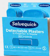
Salvequick Blue Detectable Mix Fingertip/Regular REF 51030126

Extra zacht en flexibel. Detecteerbaar door de meeste metaaldetectoren die in de levensmiddelenindustrie worden gebruikt. Salvequick Blue Detectable Pleisters. Elke navulling bevat 35 pleisters (21 st. 72 x 19 mm en 14 st. 72 x 25 mm). 6 navullingen/doors.