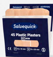
Salvequick Plasticpleisters REF 6036

Extra lange blauwe pleisters die gemakkelijk rond de vinger gewikkeld kunnen worden. Zacht en flexibel, detecteerbaar door de meeste metaaldetectoren die in de levensmiddelenindustrie worden gebruikt. Afmetingen: 120 x 20 mm. Elke navulling bevat 39 pleisters, 6 navullingen/doors.