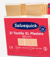
Salvequick Extra Grote Textielpleisters REF 6470

Elke navulling bevat 40 pleisters (24 st. 72 x 19 mm en 16 st. 72 x 25 mm). 6 navullingen/doors.